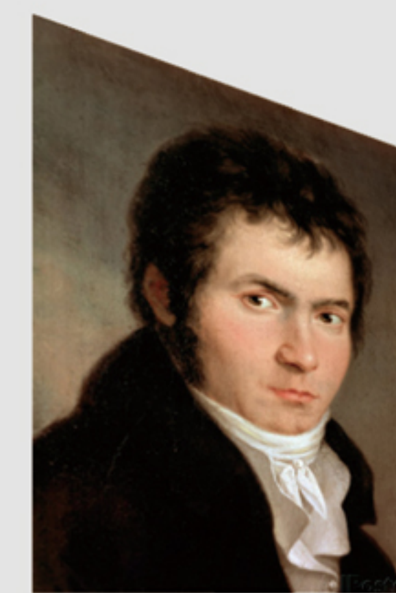
Ludwig van Beethoven (1770-1827)

String Quartet No.12 in E flat major, Op.127